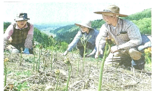
■裏面にワラビ園案内図